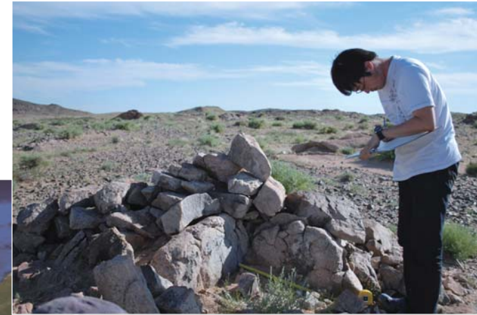
ゴビ砂漠の銅製錬址 (ジャブフラント遺跡、~BC1千年紀) Copper Smelting in Gobi (Javkhlant Site, ~1st millennium BC)