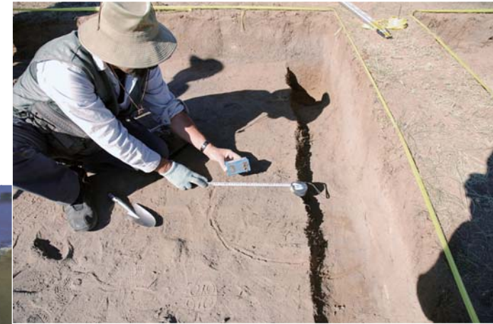
ジンギス・カンの大オールドの鍛冶遺構 (アウラガ遺跡、AD13c) Iron Production at the Genghis Khan's Orda (Avraga Site, AD13c)