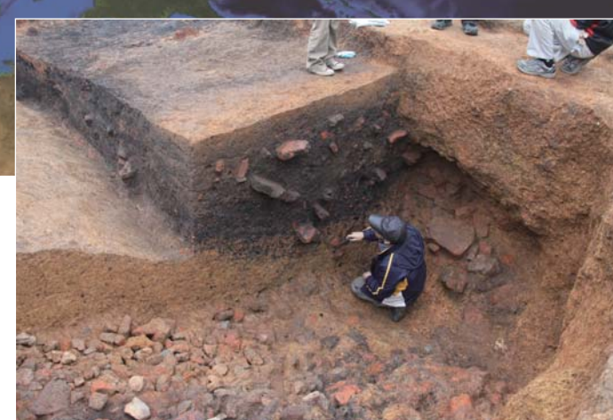
漢代鉄滓廃棄土坑 (鉄牛村遺跡、BC2c) Waste Slag and Furnace Walls in a Pit in Han Period (Tieniucun Site)