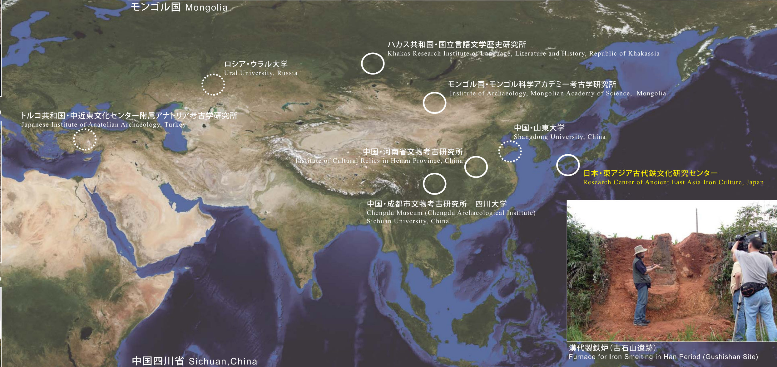
ハカス共和国・国立言語文学歴史研究所 Khakas Research Institute of Language, Literature and History, Republic of Khakassia