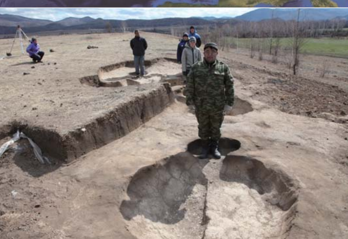
タシテイク文化の製鉄炉 (トロシキノ・イウス遺跡、AD1c) Furnace for Iron Smelting in Tashtyk Culture (Troshkisno-Iyu Site)