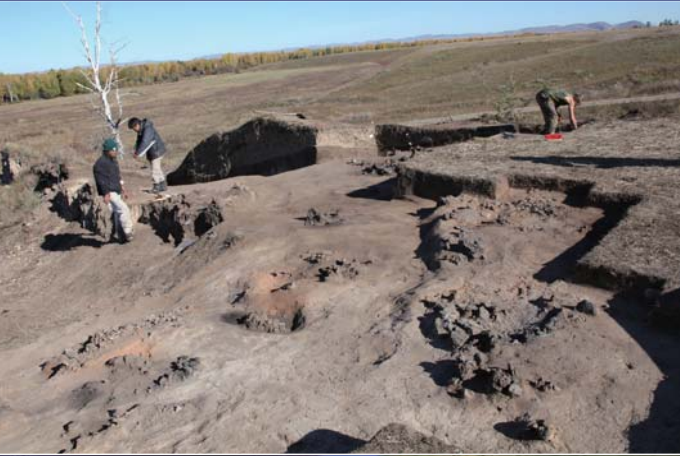
タシテイク文化の製鉄炉 (トロシキノ・イウス遺跡、AD1c) Furnace for Iron Smelting in Tashtyk Culture (Troshkisno-Iyu Site)