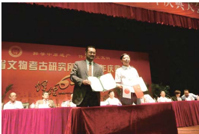
河南省文物考古研究所との研究交流締結 Collaborative Research with Institute of Cultural Relics in Henan Province, China