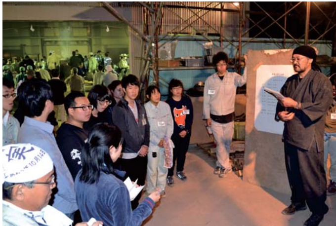
教育—鉄研究を東アジアの学生に伝える! Iron Research Seminar for Foreign Students