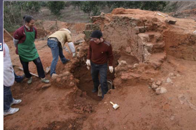
製鉄炉 (沙子堂遺跡) Furnace for Iron Smelting (Shazitang Site)