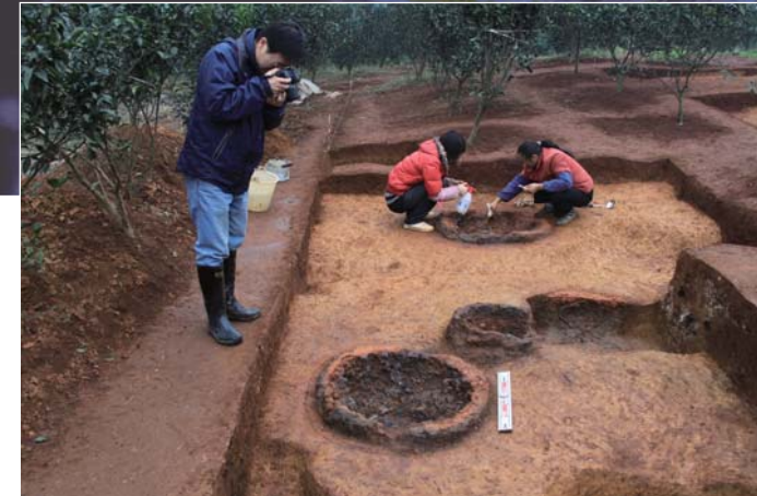
炒鋼炉 (許鞋辺遺跡) Furnace for Iron Refining (Xuxiebian Site)