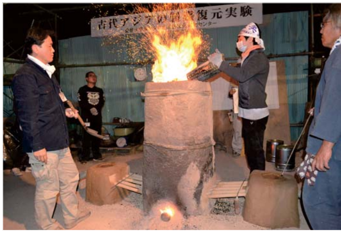
実験考古学—失われた我が国古来の製鉄技術にいだむ! Iron Making Experiments: Restoring the Ancient Technique