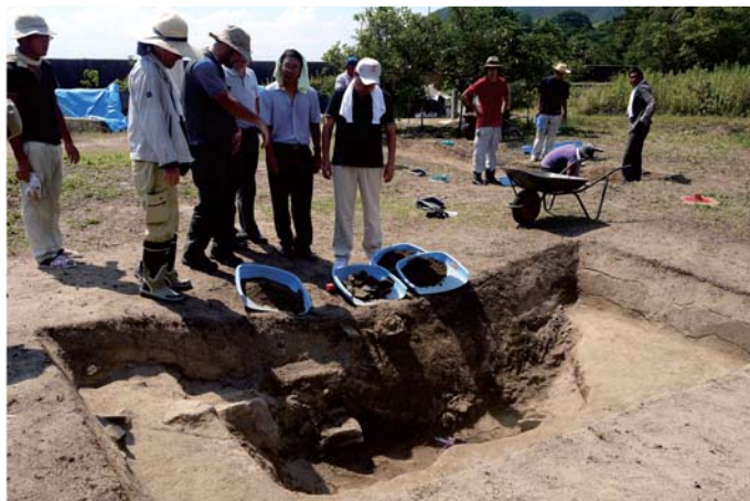
山東大学との東アジア塩業考古学の共同研究 Collaborative Research for Ancient Salt Industry with Shandong University, China