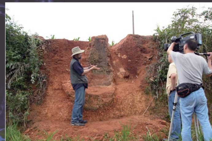
漢代製鉄炉 (古石山遺跡) Furnace for Iron Smelting in Han Period (Gushishan Site)